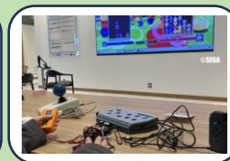
eスポーツ 支援機器体験